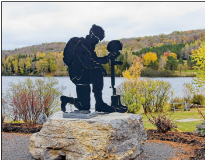
Monument situé à la Plage Michel-Jr.-Lévesque à Sainte-Véronique.