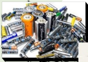
PILES : ÉCOCENTRE OU DÉPÔT DE RDD