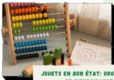
JOUETS EN BON ÉTAT: ORGANISMES DE BIENFAISANCE JOUETS BRISÉS : ÉCOCENTRE