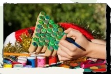
BRICOLAGES, PROJETS DÉCORATIFS : DÉCHETS