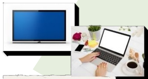
APPAREILS ÉLECTRONIQUES : ÉCOCENTRE OU DÉPÔT DE RDD

OÙ DISPOSER DE CES ITEMS? SURTOUT PAS DANS LE BAC VERT!