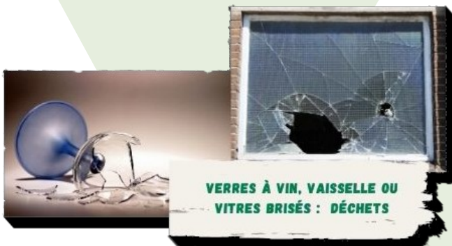
VERRES À VIN, VAISSELLE OU VITRES BRISÉS : DÉCHETS

OÙ DISPOSER DE CES ITEMS? SURTOUT PAS DANS LE BAC VERT!